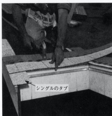
4-11図 シングルのタブを切って、けらば側のトリムの出っ張っている部分にかぶせる。

アスファルト シングルの裏打ち（スターター）の列は、アスファルト シングル材を支持し、つぎの列に葺くシングルのタブとタブとの間のギャップを埋める役目をする。裏打ちの列に使用するシングルの端から少なくとも三インチを切り取り、工場で塗装された接着剤を使用して接着しながら、屋根の下端に沿って葺いていく。シングルの継目や、第一列のタブの切り目のところに継目がこないようにして葺き始める。けらばのトリムが鼻隠しから外へ出っ張っている場合には、4~5インチ幅のシングルのタブで、けらばのトリムの上端を覆う（4-11図）。木製シングルを、タブの下側に取り付けて支えとする。